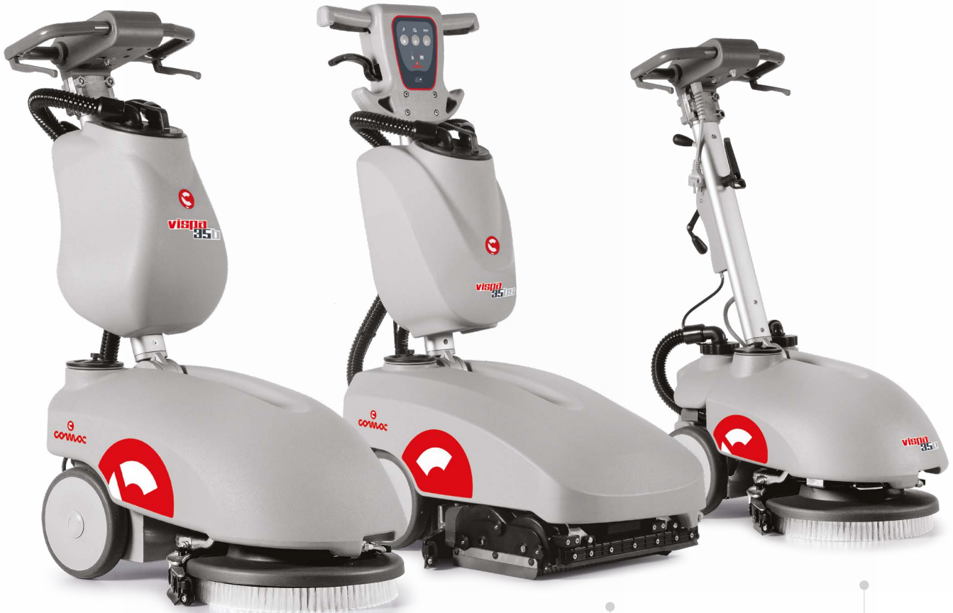
VISPA 35 B Batterieversion Version Bürstenkopf mit Tellerbürsten Arbeitsbreite: 350 mm