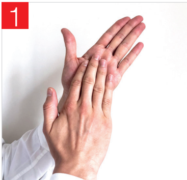
1. FROTTEZ VOS MAINS PAUME CONTRE PAUME