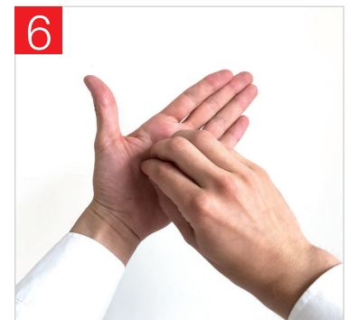
6. FROTTEMENT ROTATIF, D'AVANT EN ARRIÈRE AVEC LES DOIGTS DE LA MAIN DROITE DANS LA PAUME DE LA MAIN GAUCHE ET VICE VERSA