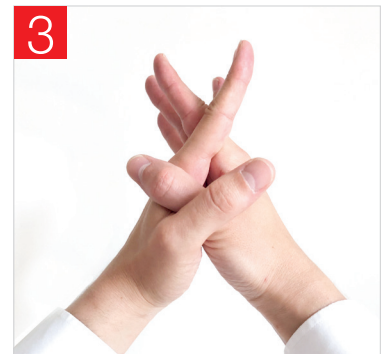
3. PAUME CONTRE PAUME AVEC LES DOIGTS ENTRELACÉS