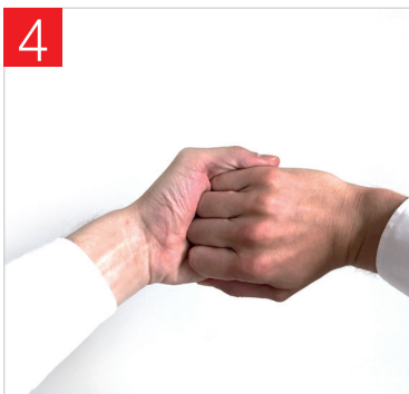
4. LE DOS DES DOIGTS SUR LES PAUMES OPPOSÉES ENTRECROISÉS