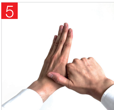
5. FROTTEMENT ROTATIF DU POUCE GAUCHE DANS LA PAUME DROITE ET VICE VERSA