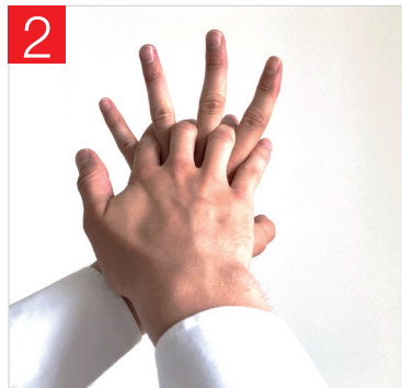
2. PAUME DROITE SUR LA PAUME GAUCHE AVEC LES DOIGTS ENTRELACÉS ET VICE VERSA