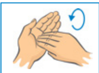
Bout des doigts