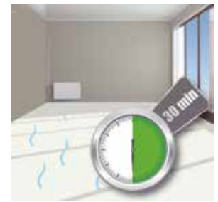
Beschichtung restfeuchter Linoleumbeläge

Für alle wasserbeständigen Belagsarten außer Holzböden, Laminat, textile Beläge und Böden, für die eine Beschichtung nicht empfohlen wird. Bestens geeignet für Krankenhäuser, Altenpflegeeinrichtungen und andere medizinische Einrichtungen, wo der Einsatz von Händedesinfektionsmitteln erforderlich ist.