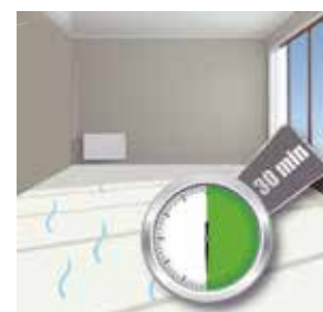
Revêtement des linoléums avec résidus d'humidité

Tous les sols résistants à l'eau, en dehors des sols en bois, des stratifiés, des moquettes, et des sols qu'il n'est pas recommandé de protéger. Idéale pour les centres de séjour, les hôpitaux et autres lieux à hauts risques, où l'utilisation de désinfectants des mains est exigée.