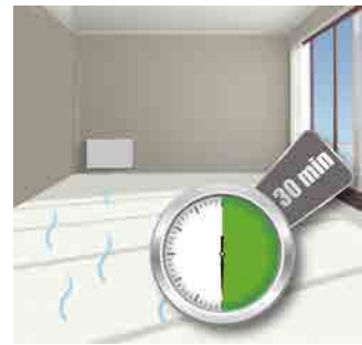
Beschichtung restfeuchter Linoleumbeläge