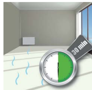
Protection des sols en linoléum exposés à l'humidité.