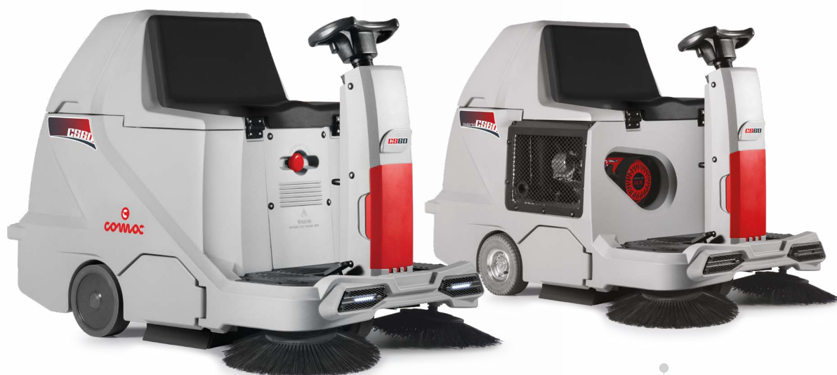
CS60 B Version batterie